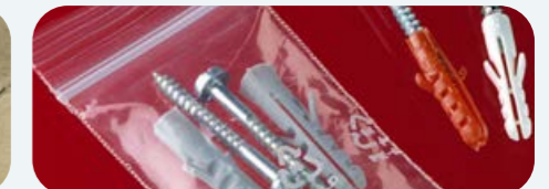
Beutelverpackungen (z.B. zwei Schrauben & zwei Dübel)