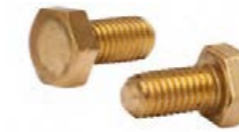
DIN 933 - Messing - M8 x 16