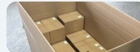
Großverpackung (bis zu 20 kg pro Umkarton)