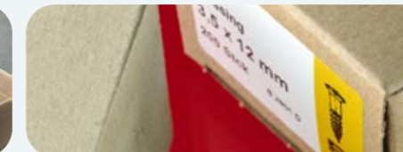
Kleinverpackungen (100/200/500 Stück)